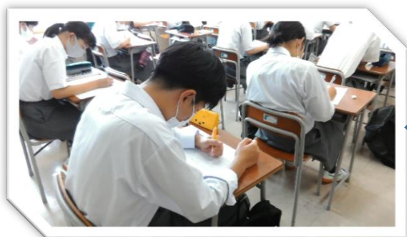
夏季講座の様子です

20 日(木)から 3 日間ではありますが、夏季講座が開かれました。夏休みの課題の復習や、今月末のベネッセ模試に向けての対策、そして授業を進めている教科もありました。