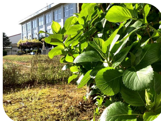
ぐんぐん大きくなっているアジサイの葉っぱ