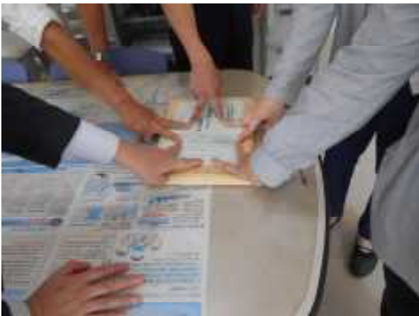
念を込めて志願書を封筒に