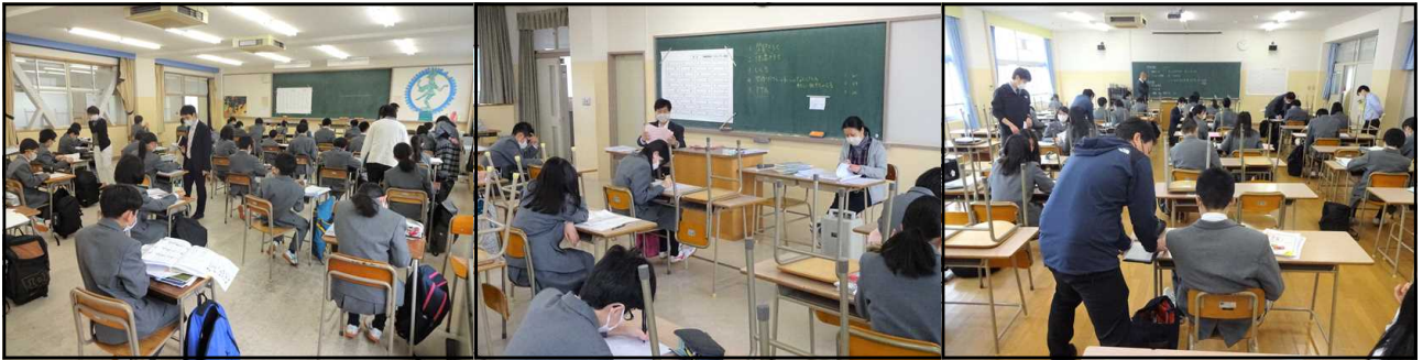
質問教室の様子（左から、1年1組英語、3年1組理・社、5年2組数学）

県立学校は、3月2日から臨時休業に入り、4月6日以降7日間授業日があっただけで、5月8日（金）に至るまでほぼ2か月間、登校禁止の状態が続きました。ご家庭におかれても、お子さんの学習の遅れや心身の健康についてご心配のことと拝察いたします。学校としては、県教育委員会の指導に従いながら、授業再開に向けて可能な限りの対応を取ってまいりたいと考えておりますので、ご理解、ご協力のほど、よろしくをお願いいたします。