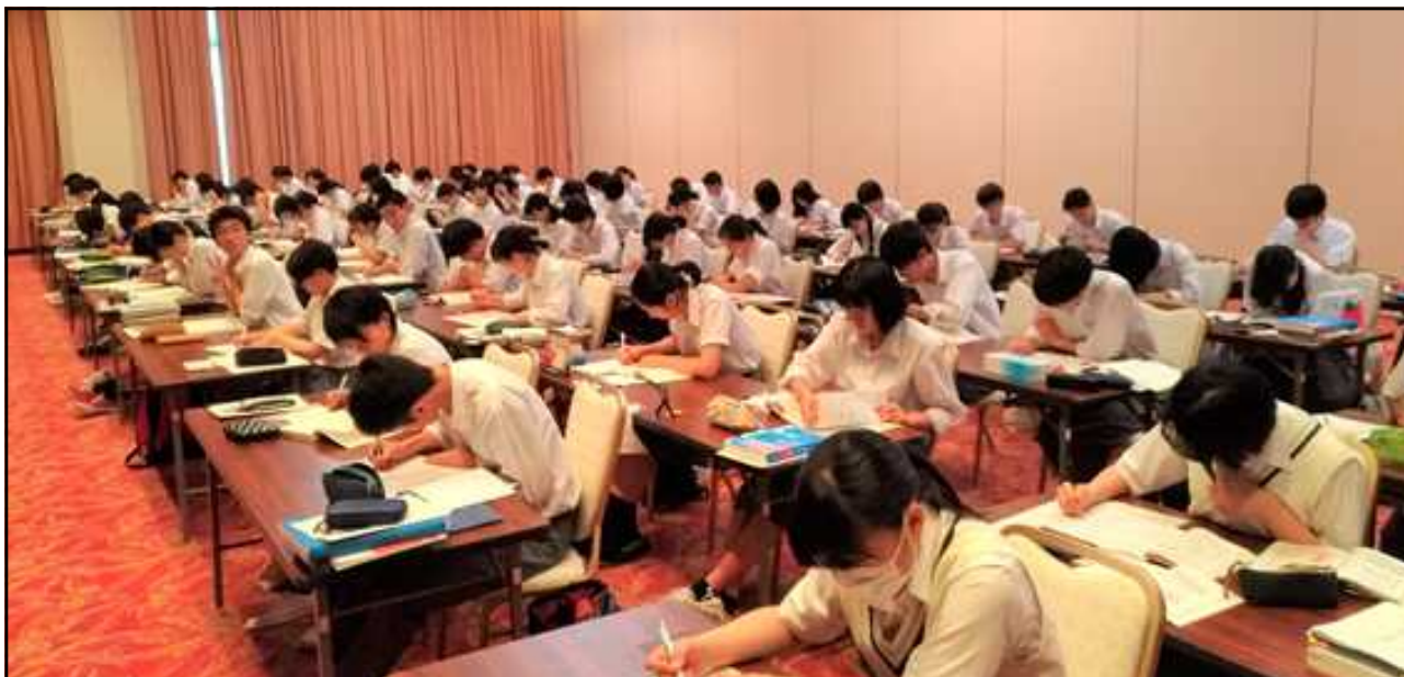
学習合宿(7/29～8/2) 一人一人が積み重なってきた努力こそ、13期生の「絆」。

大学入試センター試験まで、あと10日。だからといって必要以上に焦ることはない。一次特編、冬季講座と、この1か月間の努力を本番まで着実に継続していけばよいのだ。ここへきて急なペースアップやペースダウンは禁物。 現役生は試験当日まで伸びる 。このことを信じて、ラストの調整に取り組んでほしい。