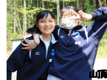
達成感 野花と共に 喜びが