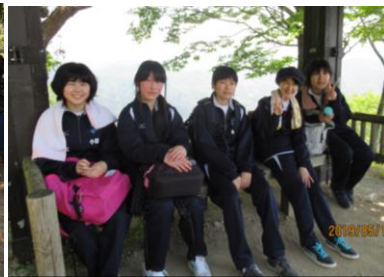
山頂で 疲れた体に 風薫り