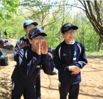
山頂で 楽しむ絶景 夏香る