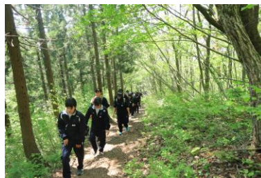
山なのに 山びこ全然 響かない