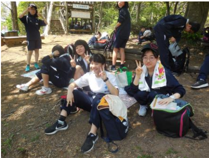
足元を見れば湧き水 流れてる

5月10日（金）、日本国登山を実施しました。今回の頑張りや経験で得たものがたくさんあります。それらを含め、登山をして感じたことを「俳句」にしてもらったものを紹介します！