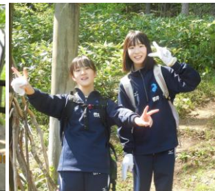
下山中 ウグイスの声 聞きながら