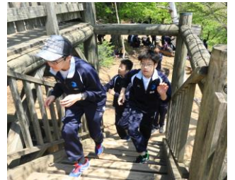
山頂に 着いた直後の 達成感