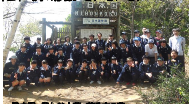
日本国 豊かな山菜 茂る木の葉